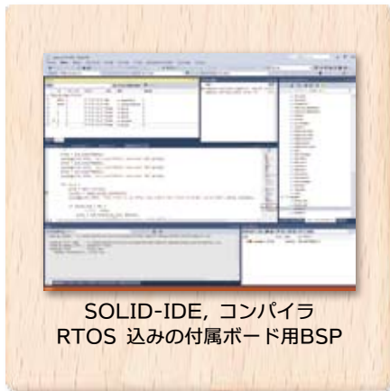
SOLID-IDE, コンパイラ RTOS 込みの付属ボード用BSP